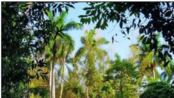
La Jungla de Jones / Jones's Jungle

A visit to the Applied Arts Workshop, transfer by bus to Jones's Jungle, where you can enjoy the natural curiosities from the place, and, later, watch the crocodiles in their natural habitat.