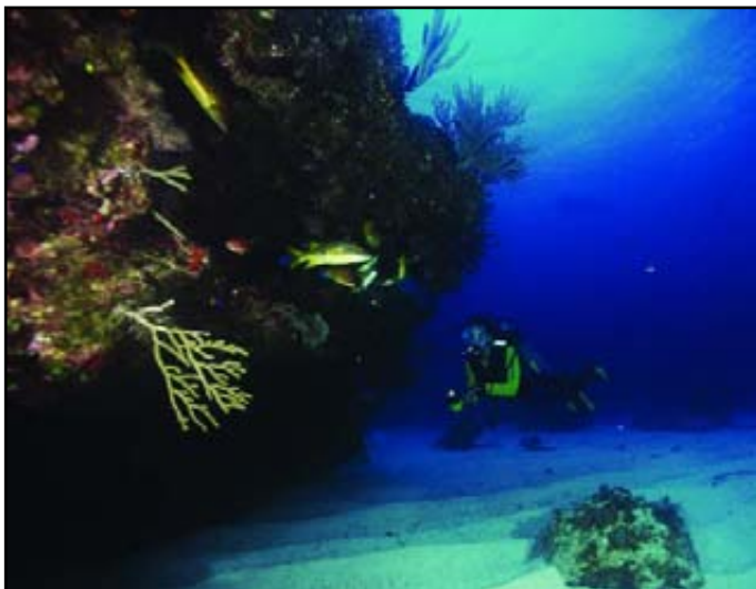
Centro Internacional de Buceo Colony.

coralino ubicado a 15 metros y que cae hasta los 30 metros.